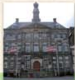
Een 'Hotel de Ville' is geen hotel!