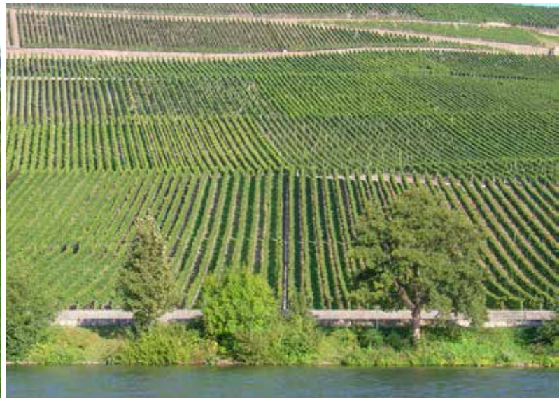
Langs de Moezel.

Voncq ontdekken we een mooi uitzichtpunt. Na wat klimmetjes arriveren we in Grandpré . Daar genieten we volop van onze favoriete chambre d'hôtes, annex table d'hôtes: Domaine Montfix , gevestigd in een grote boerderij. Vooral de maaltijd is een belevenis. Iedereen zit bij elkaar in de grote 'eetzaal' en er wordt heerlijk Frans geschranst.