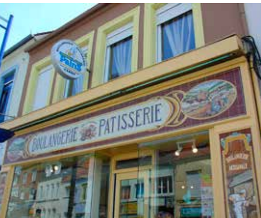
Faïence gevel in Dèsvres.