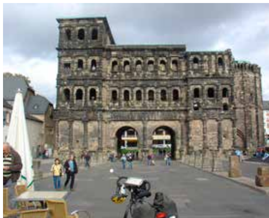
De Porta Nigra in Trier.