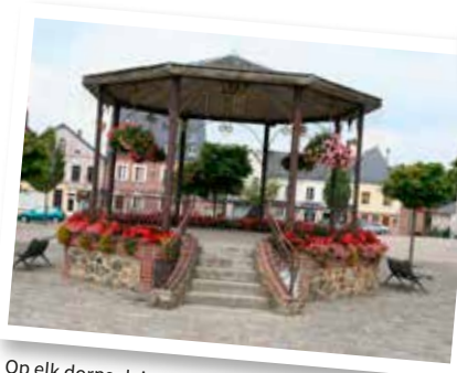
Op elk dorpsplein een kiosk.

We fietsen even langs het Canal des Ardennes en daarna op een heuvelrug langs de Aisne. In