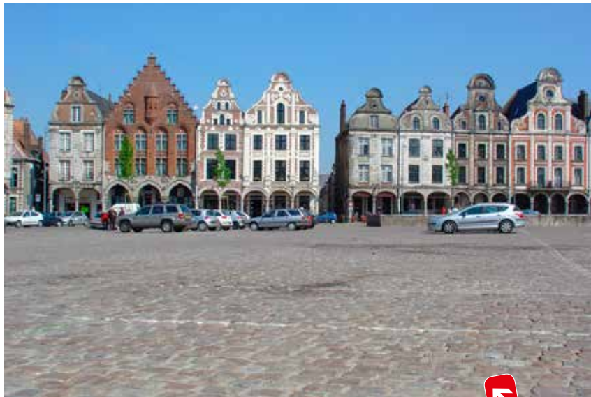
Arras behoorde ooit tot de Zuidelijke Nederlanden.