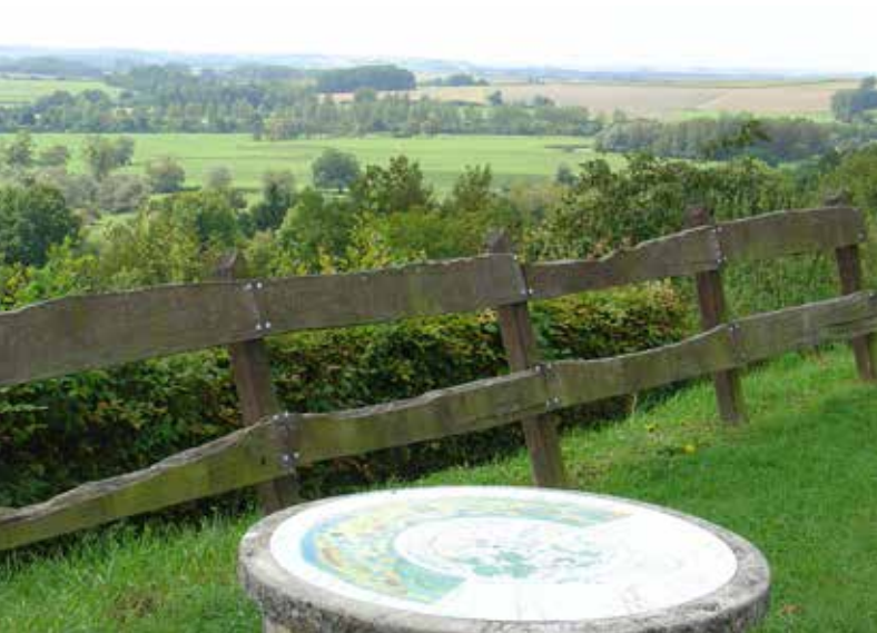
Panorama op de vallei van de Aisne in Voncq.