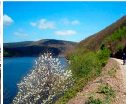
Langs de Rursee in de Eifel.