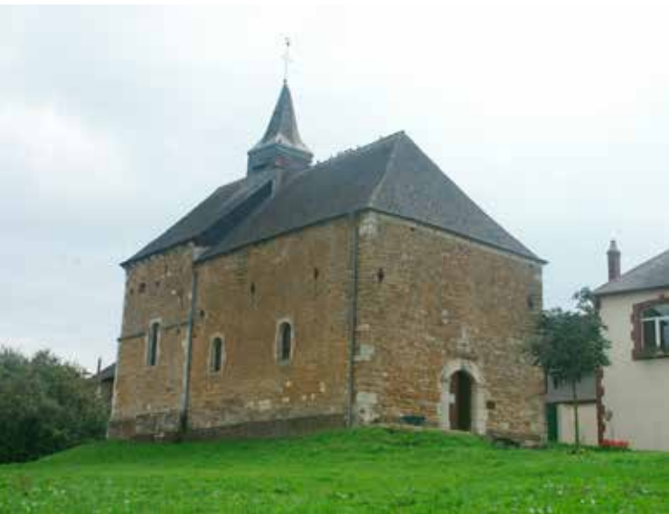
Een versterkte kerk in de Thiérache.