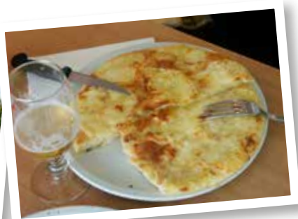
Flamiche de Maroilles.