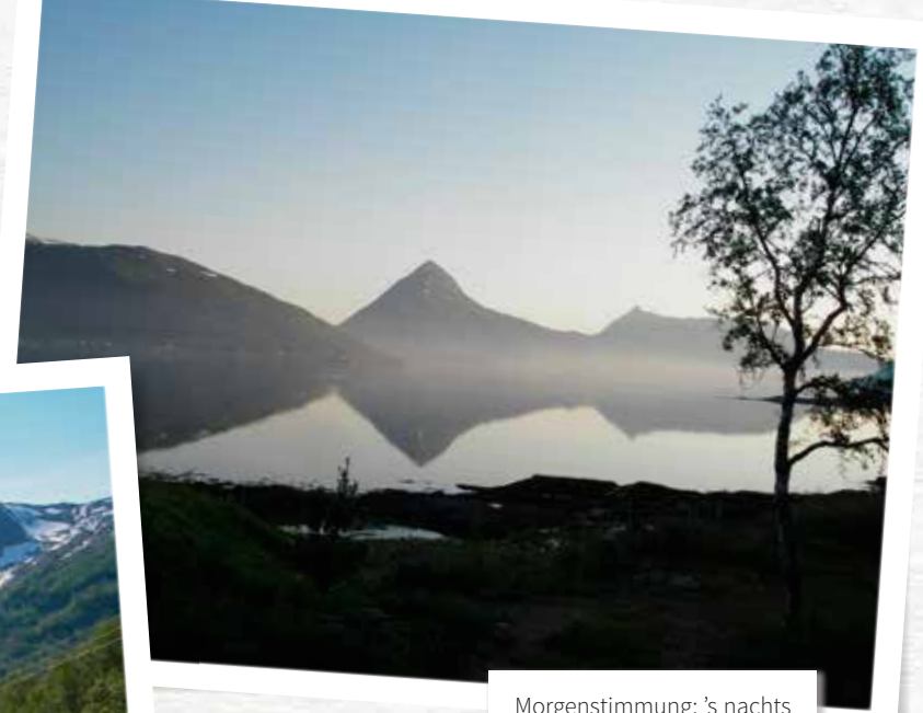
Morgenstimmung: 's nachts om drie uur verstopten de trollen zich achter de nevels.