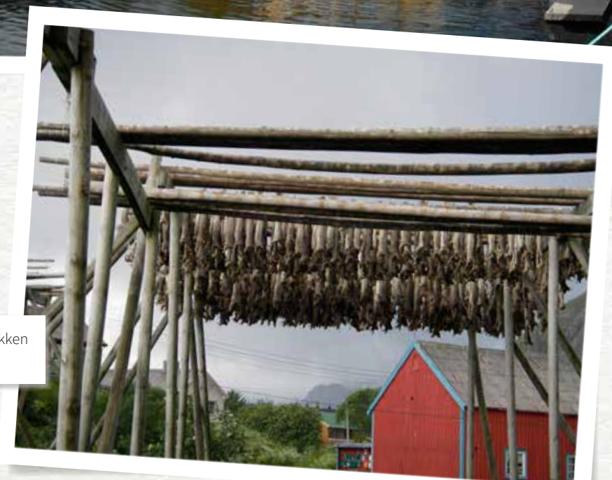
Overal op de Lofoten zie je rekken met drogende stokvis.