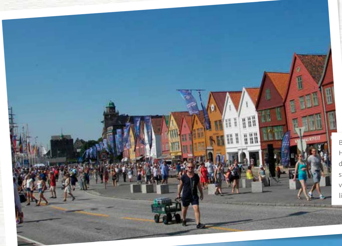
Bergen, een oude handels- en Hanzestad, is het startpunt van de route. Tijdens Sail 2014 is de stad in zijn element, er is veel volk op de been en tall ships liggen langs de kade.