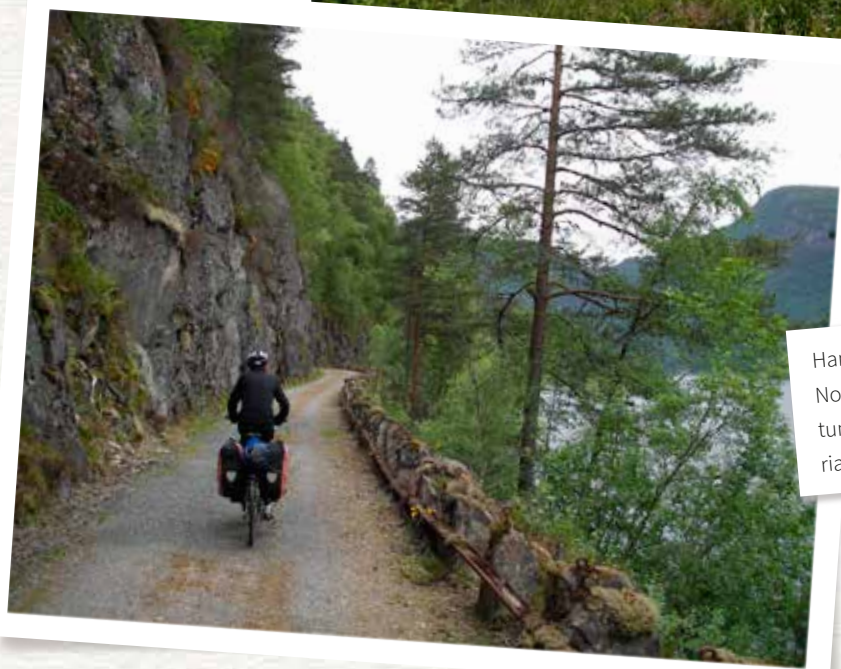
Handig: met hun oliedollars hebben de Noren heel veel wegen rechtgetrokken met tunnels en bruggen. Wat overblijft is een riant fietspad met uitzicht op de fjord!