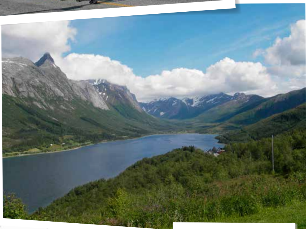
Elke klim langs een fjord wordt beloond met een uitzicht over de hele baai en de omringende bergen.