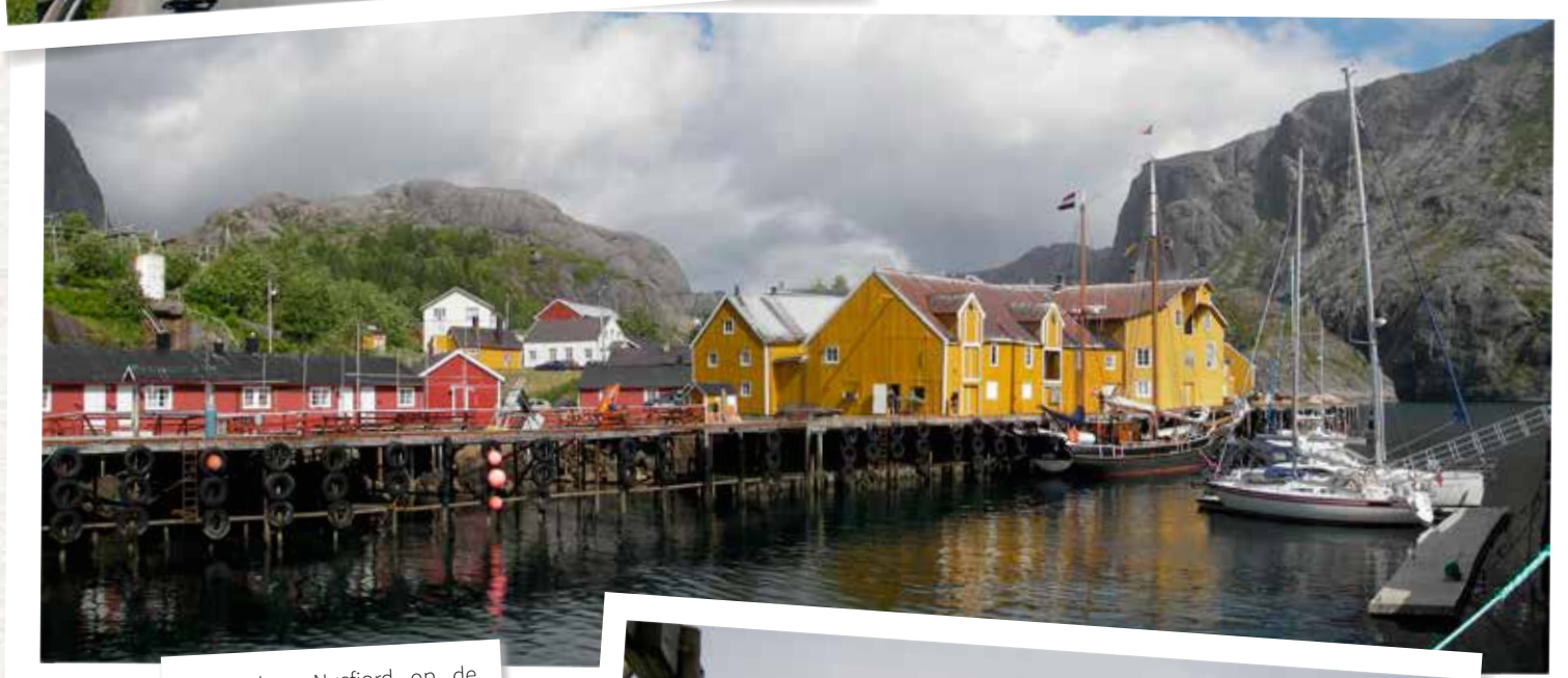
Vissersdorp Nusfjord op de Lofoten: gerestaureerd voor de toeristen, maar slechts weinigen weten het te vinden.